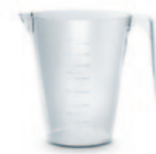
2 емкости для сока и мякоти объемом 1,4 л