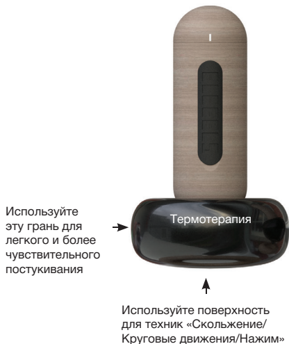
Палочка с плоским камнем