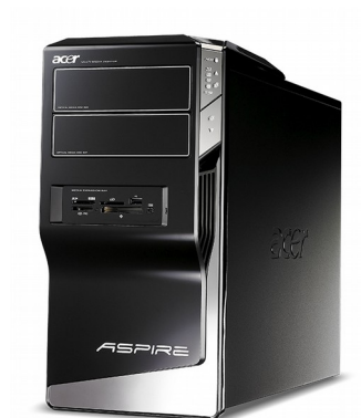
Модели: Aspire M5300, M5800, M5810