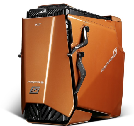
Модели: Aspire G7200, G7300