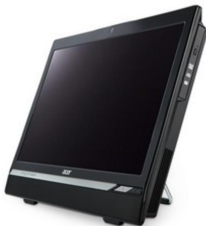
Модели: Aspire Z3170, Z3171, Z3770, Z3771, Z5770, Z5771