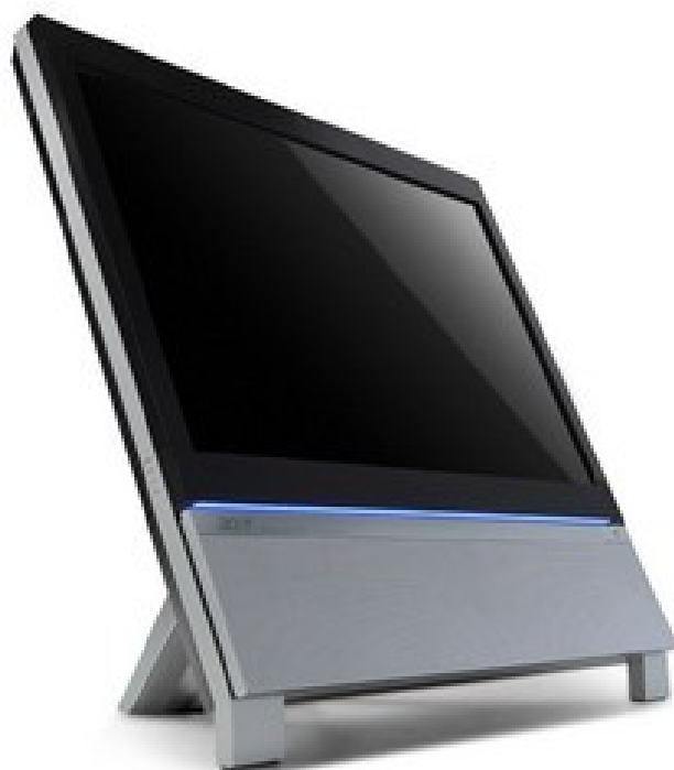
Модели: Aspire Z3620, Z3680