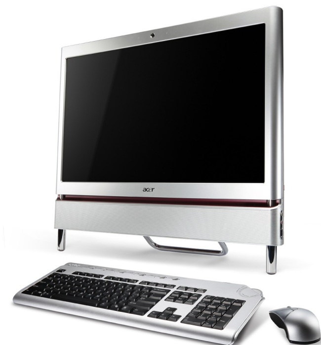
Модели: Aspire Z3100, Z3101, Z3730, Z3731, Z3750, Z3751, Z3760, Z3761, Z5101, Z5751, Z5761, Z5763