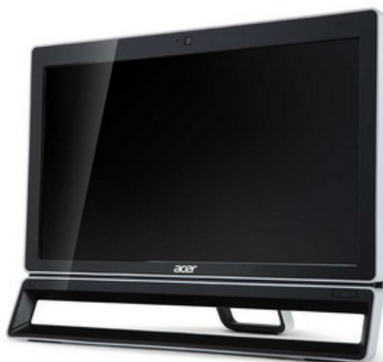
Модели Z3801, Z5801