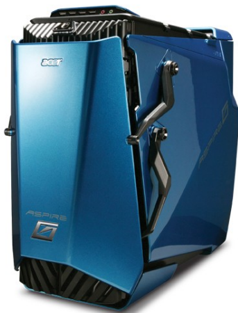
Модели: Aspire G7750, G7760