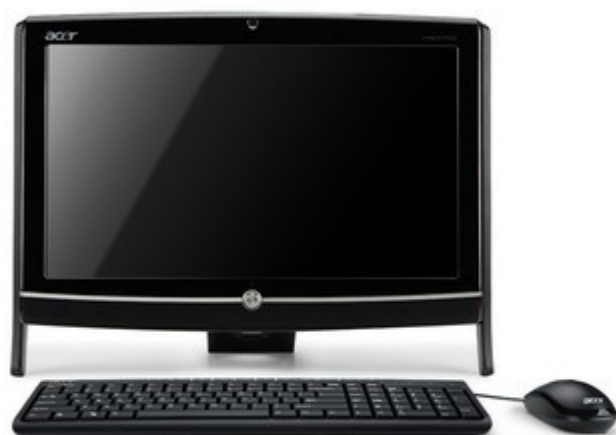
Модели: Aspire Z5600/5610/5700/5710