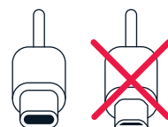
USB-C USB micro-B

Чтобы включить телефон, нажмите клавишу питания и удерживайте ее нажатой, пока телефон не завибрирует. Телефон поможет выполнить настройку.