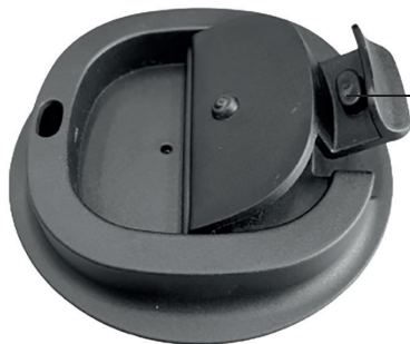
Клапан в открытом положении

Примечание. Находящийся внутри термокружки напиток может быть очень горячим. Проверяйте температуру напитка перед тем, как сделать глоток.