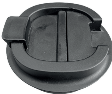
Клапан в закрытом положении