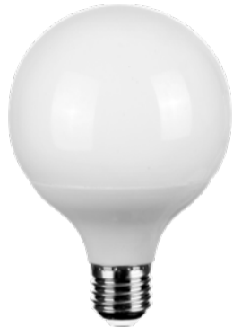
Светодиодная WiFi лампочка SLS