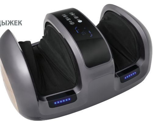
KZ 1180 МАССАЖЕР ДЛЯ НОГ СО СЪЕМНЫМИ ЛИМФОДРЕНАЖНЫМИ МАНЖЕТАМИ ВИВО