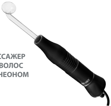
KZ 1175 ИМПУЛЬСНЫЙ МАССАЖЕР ДЛЯ ТЕЛА, ЛИЦА И ВОЛОС С 5 НАСАДКАМИ С НЕОНОМ ДАРСОНВАЛЬ