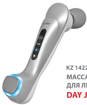
KZ 1422 МАССАЖЕР ВИБРАЦИОННЫЙ ДЛЯ ЛИЦА И ТЕЛА DAY JOY