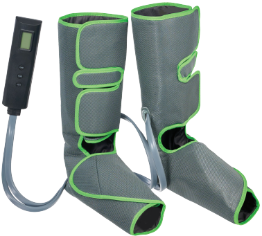
KZ 1166 КОМПРЕССИОННЫЙ ЛИМФОДРЕНАЖНЫЙ МАССАЖЕР ДЛЯ НОГ