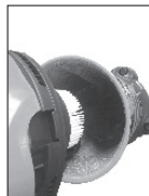
Diagram of the machine's disassembly and assembly / Схема замены НЕРА фильтра