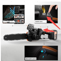
Замена цепи электропилы Futula ES12