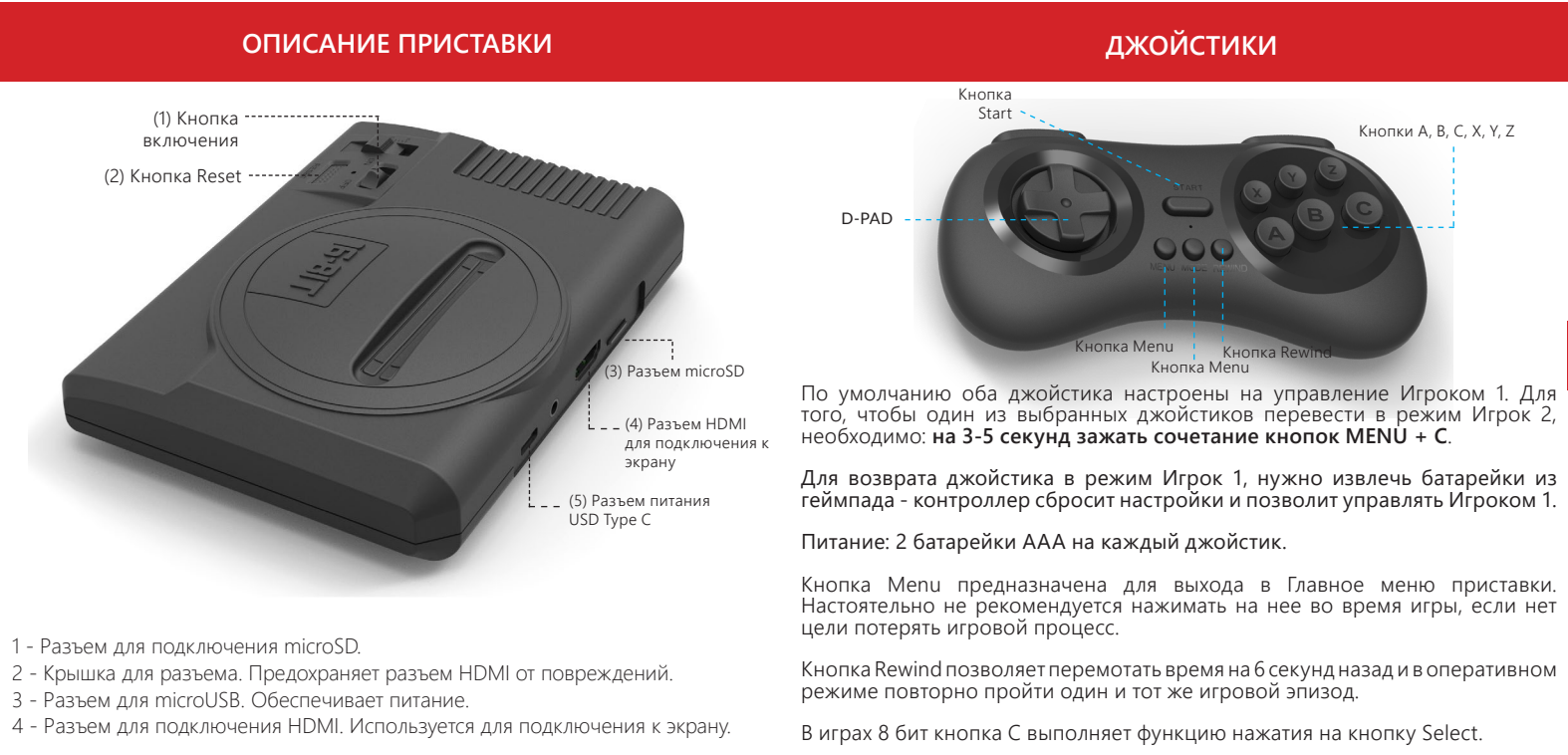
СХЕМА ПОДКЛЮЧЕНИЯ И ВКЛЮЧЕНИЕ УСТРОЙСТВА

В редких случаях, во время игры в видеоигры, у людей могут возникать эпилептические припадки. Яркие краски, частая смена изображения и прочие характерные признаки способствующие эпилептическим припадкам, появляются, в той или иной мере, во время почти любой игры. Пожалуйста, проконсультируйтесь с врачом, прежде чем играть в видеоигры, если у вас когда-либо были эпилептические состояния или припадки. А также, при любом из следующих симптомов во время игры: нарушение зрения, глазные или мышечные судороги, спутанность сознания и потеря сознания, дезориентация в пространстве или непроизвольные движения. Рекомендуется делать перерывы не менее 20 минут после каждого часа непрерывной игры.