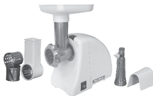
Электромясорубка “Экстра-р” с функцией реверс