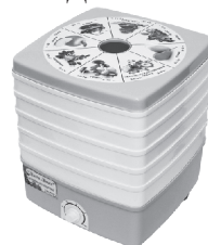
Электросушилка “Дива Люкс”