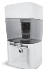
Система очистки питьевой воды бытовая “КАТУНЬ”