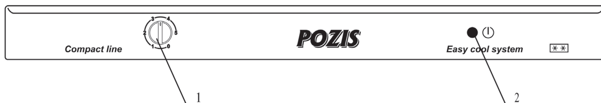
Рис.2 Регулировка температурного режима 1 – ручка терморегулятора 2 – индикаторная лампа (сеть)

После выхода в режим ручку терморегулятора переведите в положение «3». В процессе эксплуатации Вы можете регулировать температуру следующим образом: при чрезмерном охлаждении продуктов в холодильной камере ручку терморегулятора поверните против часовой стрелки, при недостаточном охлаждении - по часовой стрелке.