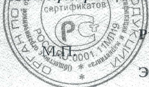
Схема сертификации № 3

ДОПОЛНИТЕЛЬНАЯ ИНФОРМАЦИЯ Маркировка продукции знаком соответствия производится по ГОСТ 30460-92. Место нанесения знака соответствия - на изделии и (или) на упаковке и в сопроводительной документации.