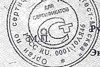
Схема сертификации - 3.

Маркирование знаком соответствия по ГОСТ Р 50460-92.