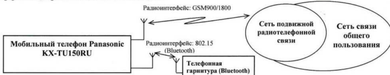
Схема подключения к сети связи общего пользования с обозначением реализуемых интерфейсов, протоколов сигнализации:

Генеральный директор ООО «Панасоник Рус»