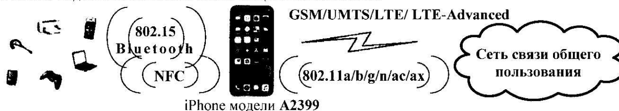
iPhone модели A2399

2.5 Схема подключения к сети связи общего пользования: