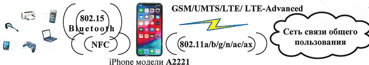
iPhone модели A2221

(маркетинговое наименование iPhone 11) торговой марки Apple