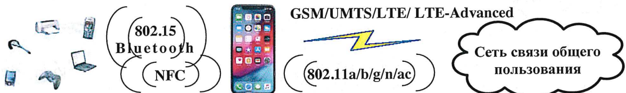
iPhone модели A2215

2.5 Схема подключения к сети связи общего пользования: