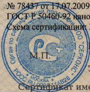
Схема сертификации: За.

ДОПОЛНИТЕЛЬНАЯ ИНФОРМАЦИЯ Сертификат системы менеджмента качества ISO 9001:2000 № 78437 от 17.07.2009 г., выданный ОС "SGS". Место нанесения знака соответствия: знак соответствия по ГОСТ Р 50460-92 наносится на корпус изделия и (или) в эксплуатационную документацию.