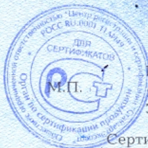
Схема сертификации: 2.

Руководитель органа (уполномоченное лицо) Эксперт